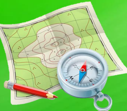
Карта и компас